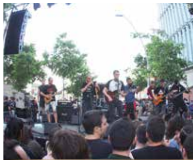
Fotografia Lád Cúig

Nit Jove , amb Lád Cúig, Aspencat, Ebri Knight, , i el Dj Acció sonora antifeixista