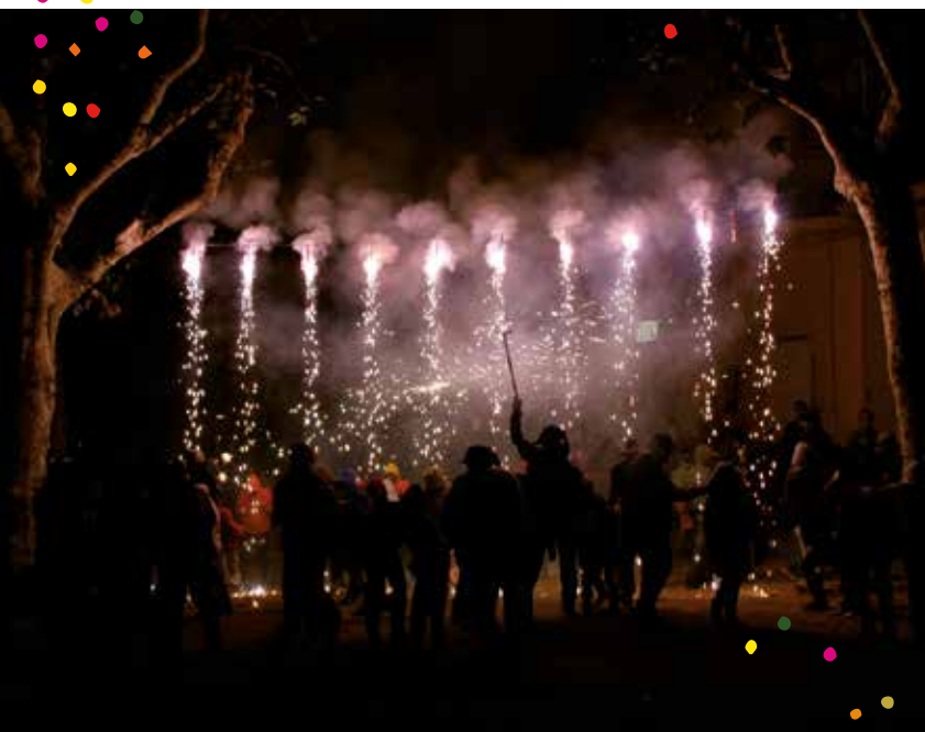
Fotografia de Jordi Torrent

..... Correfoc , a càrrec de Diabòlics Anònims de Vilassar de Dalt